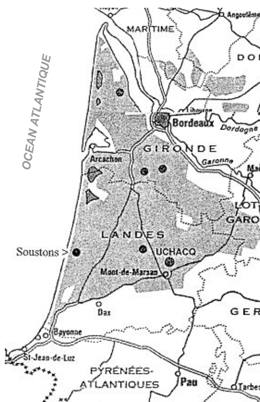
Fig. 1. Regiunea Aquitaine

Devenită provincie romană (Aquitania) sub Augustus, apoi loc de popas pentru vizigoți, în evul mediu măr de discordie