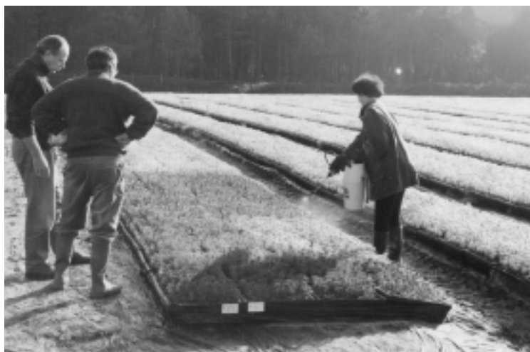
Fig. 2. Pepinierele din regiune sunt specializate în cultura pinului maritim și sunt în stare să livreze milioane și milioane de puiți. Acești sunt tratați în prealabil cu un repeelent contra daunelor cauzate de cervide

majoritate (92 %) particulare, bazate pe monoculturi complet mecanizate, axate pe producție și profit! În anul 1990 producția lemnoasă a fost de 8,3 milioane m 3 , dintre care 5 milioane lemn de lucru și 3,3 milioane lemn pentru necesitățile industriei, în primul rând celuloză. În sectorul pădure-industria lemnului erau înregistrate 4 415 întreprinderi.