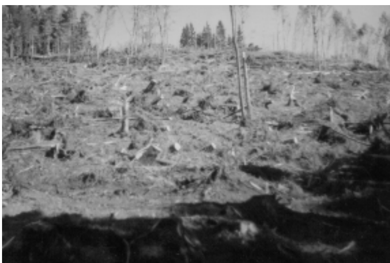
Fig. 5. Degajarea grabnică a suprafețelor răvășite de vânt și scoaterea lemnului pe piață a avut urmări fatale: prețurile au scăzut până la jumătate. Din lipsă de mijloace, reîmpădurirea stagnează.

de două uragane. Primul, la 26 decembrie, s-a deplasat pe o bandă de aproximativ 150 km lățime de la apus spre răsărit, cam de-a lungul paralelei de 45 grade. Este vorba de așa numitul Lothar. O zi mai târziu a urmat altul, mai către sud. Mai ales Lothar a făcut ravagii. Pornit ds pe coasta Atlanticului, nu s-a domolit decât în Austria. În ocolul silvic german Lahr de pe dreapta Rhinului a culcat