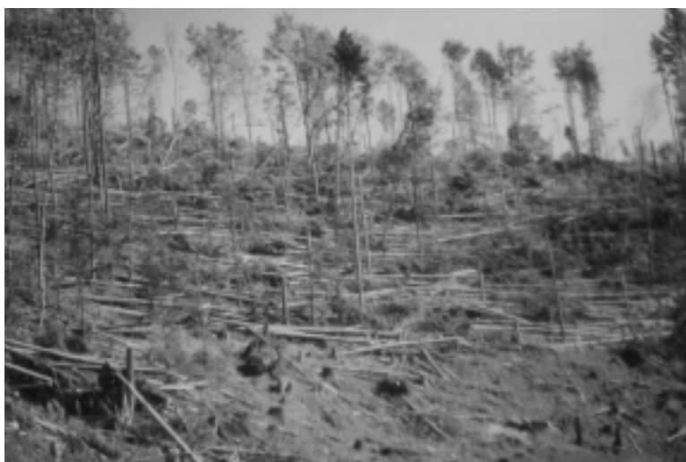
Fig. 4. Aspect din lanțul muntos Vosges, din apropierea frontierei cu Germania. Pornit de pe coasta Atlanticului cu o viteză în jur de 100 km/h, uraganul aproape că și-a dublat energia pe parcurs.