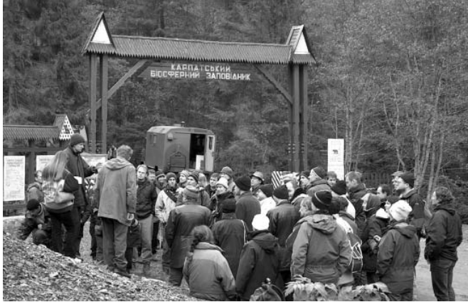
Intrarea în rezervația Chornohirski

tante rezervații naturale din Transcarpatia: Uholka și Chornohirski. Prima este o rezervație în majoritate cu fag, în timp ce a doua include amestecuri de fag cu rășinoase și molidișuri; menționăm ca argument pentru a evidenția diversitatea asociațiilor forestiere prezente faptul că în cea din urmă se găsește și cel mai înalt vârf din Ucraina - Hoverla (2061 m).