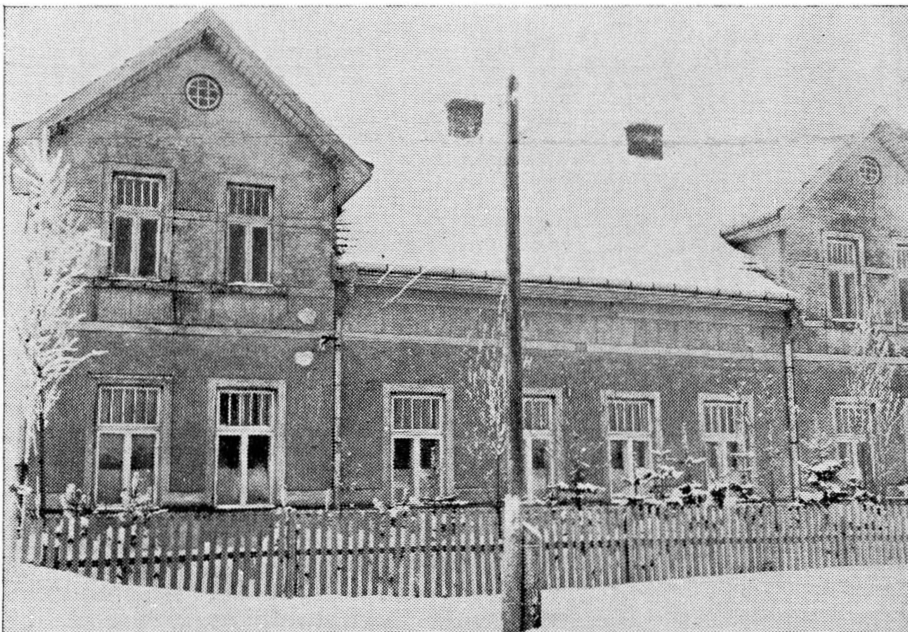
Internatul Școalei silvice Rădăuți.

Școlile la Stat admit elevi cu numai 7 ani de învățământ primar, iar anii de practică necesari a înțelege mai bine cursurile, s'au transformat în anul III de practică.