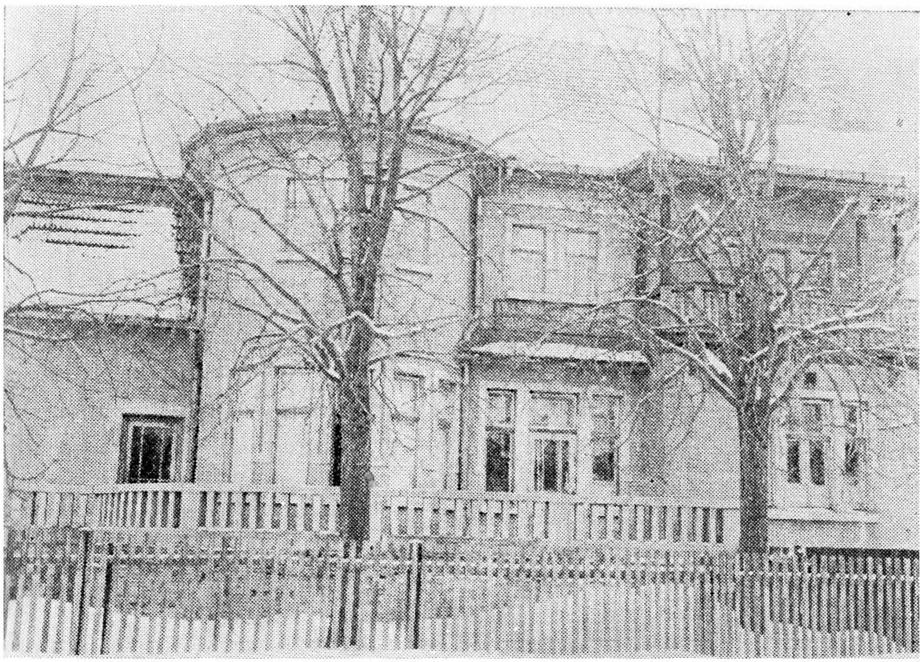
Școala silvică din Rădăuți.

Imediat după războiul mondial, Administrația Fondului Bisericesc s'a străduit să reactiveze în continuare vechea școală din Codrul Cozminului, la Rădăuți. Programa de învățământ și cursurile se predau după Volumul de silvicultură Eckert-Lorenz, care s'a dovedit ca unul din cele mai bune manuale didactice.