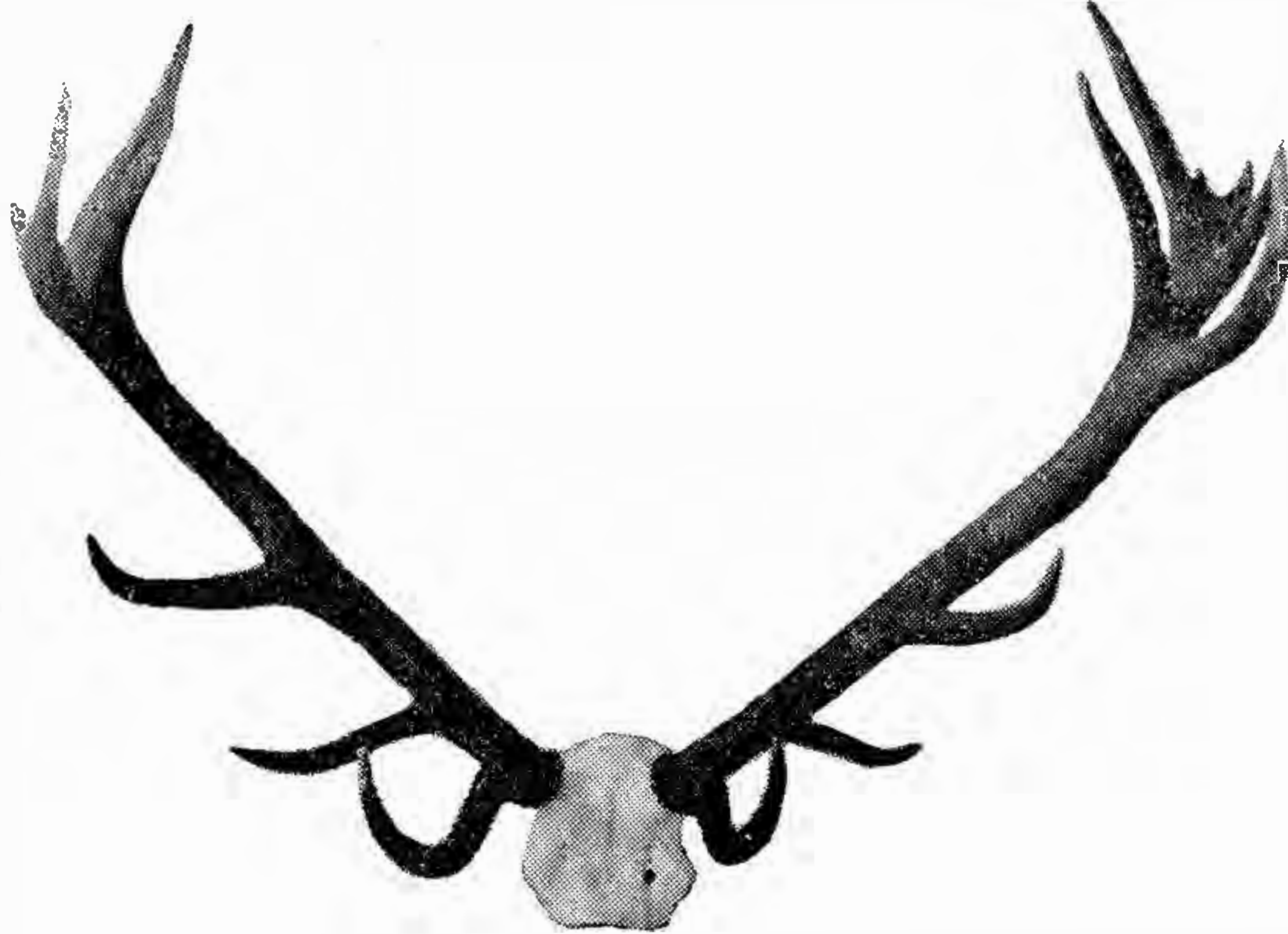
Trofeul G. Luța