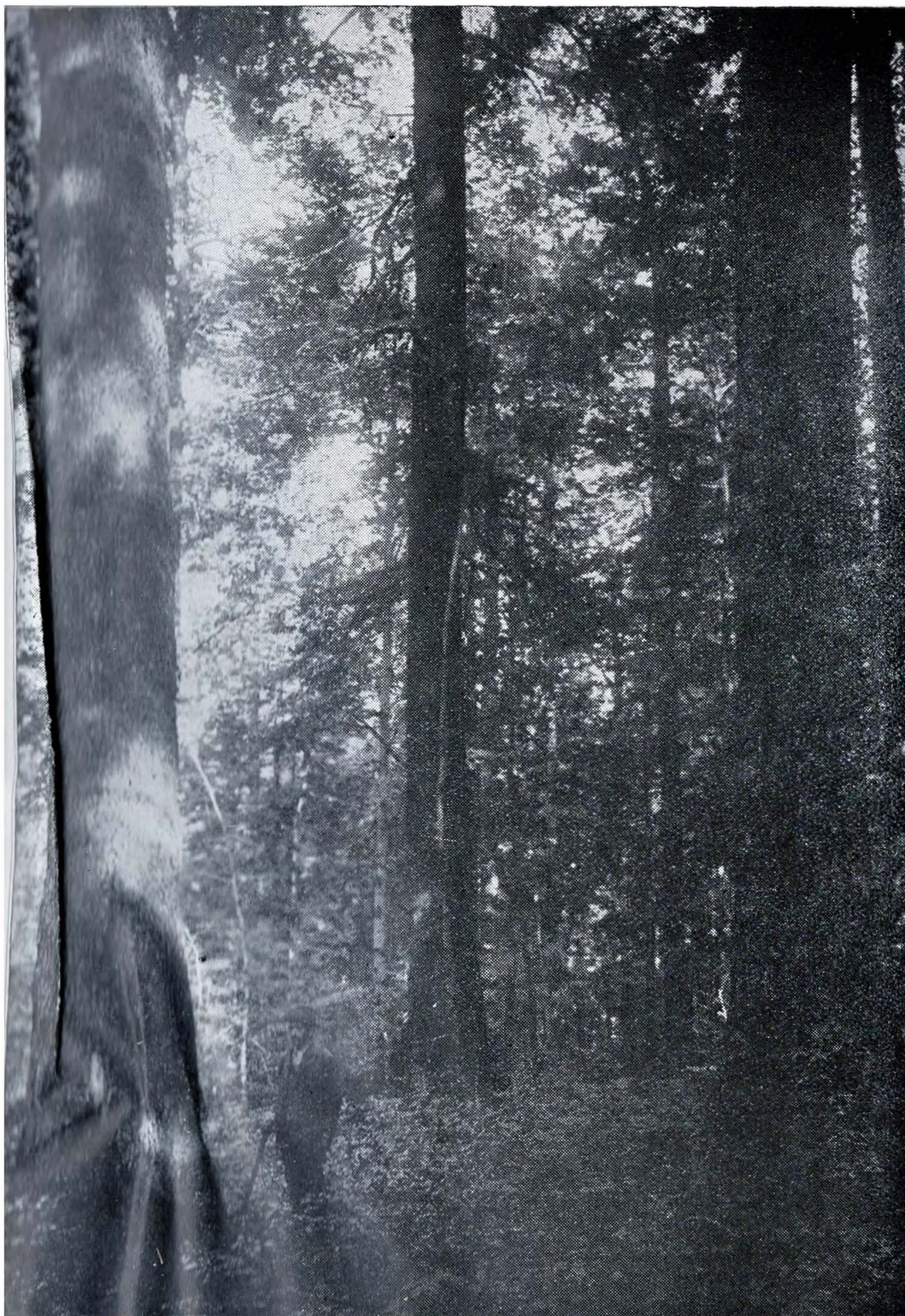
Pădure seculară din ocolul silvic Gura-Homorului