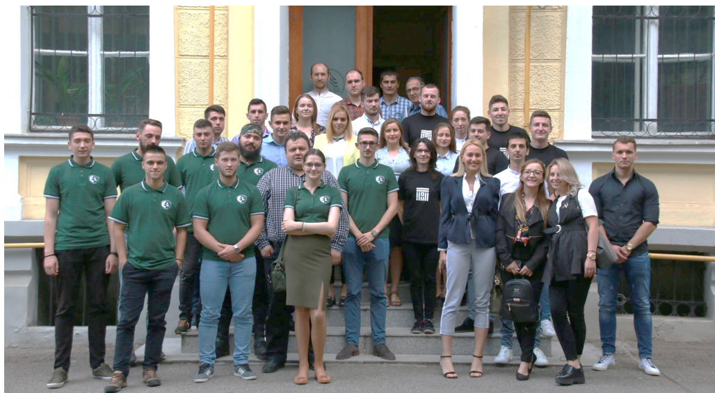
Participanți la cea de a IV-a ediție a Sesiunii Naționale de Comunicări Științifice Studențești, Brașov 2018

Gazdele evenimentului au fost doamna șef