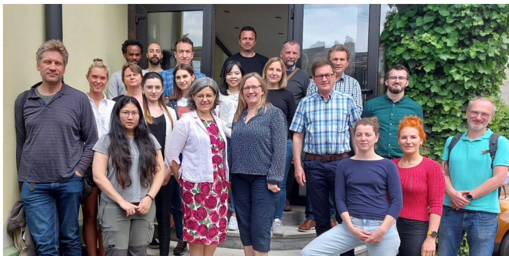
Fotografie de grup cu participanții întâlnirii din cadrul proiectului EFFECT Group photo with the participants of the EFFECT project meeting