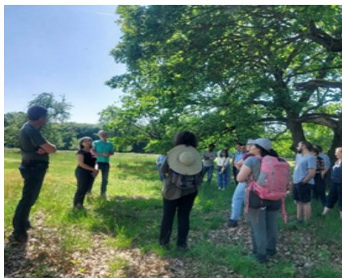
Activitatea din teren în zona Breite Field activity in the Breite area

Fundației ADEPT, aceștia prezentând formele de sprijin ale fermierilor români, modul de accesare al fondurilor și direcțiile de dezvoltare viitoare. Apoi au urmat o serie de prezentări care au ilustrat diverse subiecte precum: managementul nutrienților solurilor din Catalonia, Spania, disponibilitatea fermierilor maghiari de a adopta noi scheme de irigare, valorile de conservare și conflictele peisajelor agricole multifuncționale de la nivelul României.